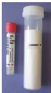
Märkning av prov och transporthylsa