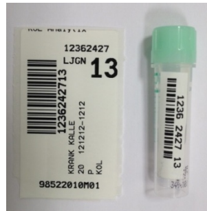
Övriga prov Märk med liten etikett. Bifoga alltid stora etiketten med namn, personnummer och streckkod.