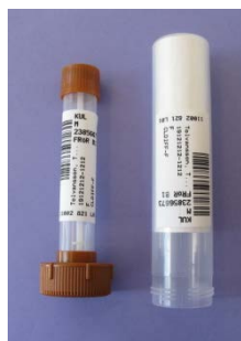
För feces, TB och sputumprov till mikrobiologi skrivs en extra etikett ut för märkning av transporthylsa.