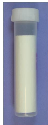
Frasco para transporte para clamidia