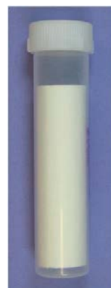
Qafiska lagu soo qaadayo