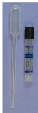
Xirmada kalamiidiya ee kaadida