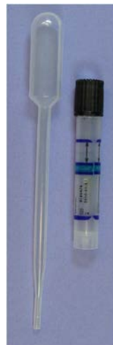
Set de dépistage de Chlamydia échantillon d'urine