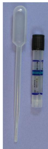
Set za uzimanje brisa na klamidiju