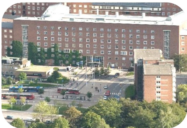
Kliniskt Träningscentrum Solna