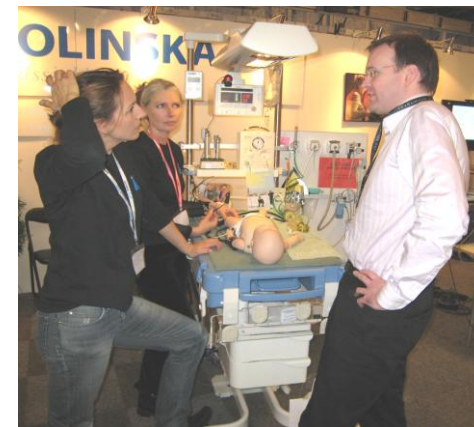
Teamträning STC - Barnsimulering