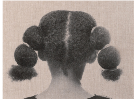
▲ 9. Bubbles, 2015, Andrea Davis Kronlund, förlossningsavdelning