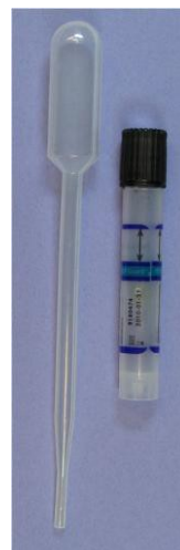
Kit de orina para clamidia