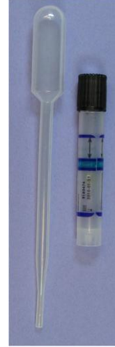
İdrar için Klamidya seti