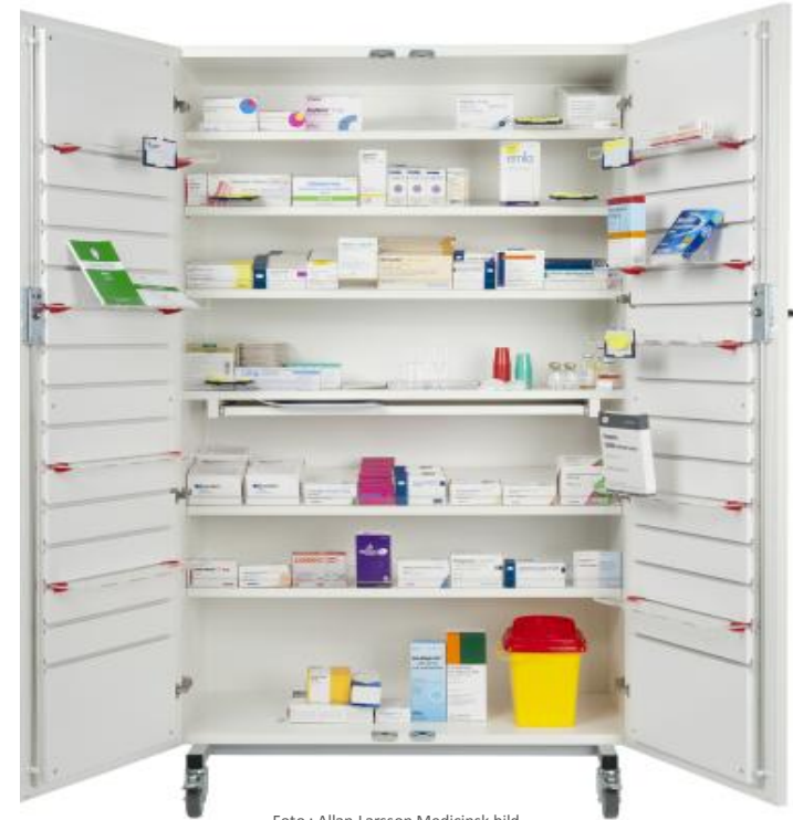
Foto : Allan Larsson Medicinsk bild Tillverkare av prototyp: Extern företag

vid föreläsningar och för praktiskt handhavande