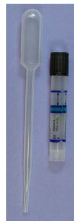
Klamidija set za mokraću