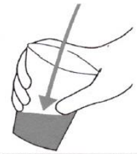
För sedan in burken i urinstrålen.