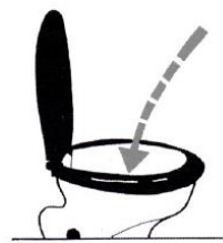
Tag bort burken och kissa färdigt i toaletten.