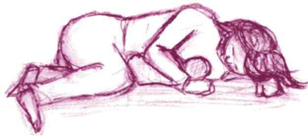
Illustration: Anna Herting

Som däggdjur betraktat är människan en art som föder väldigt hjälplösa ”ungar”. Barnet utvecklas långsamt och är beroende av andra under en mycket lång period för att få mat, för att få sociala och känslomässiga behov tillfredsställda och för förflyttning. De senaste decennierna har man inom forskningen allt mer börjat betona det späda barnets behov och psykiska förmågor. Spädbarnet har, trots sin hjälplöshet, en välutvecklad förmåga att kommunicera med och reagera på signaler från andra människor och har stort behov av både beröring på huden och rytmiskt vaggande och gungande rörelser. Ett barn som är oroligt påkallar föräldrarnas uppmärksamhet genom skrik eller kroppsrörelser och blir ofta lugnat av att bli buret, vaggat och smekt över kroppen.