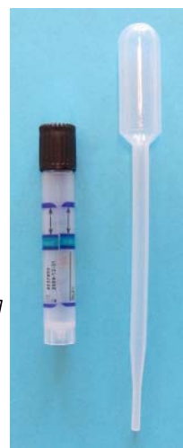
Klamydiaset för urin